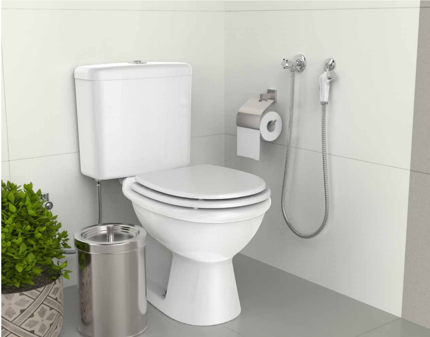
VISTA DE APLICAÇÃO.