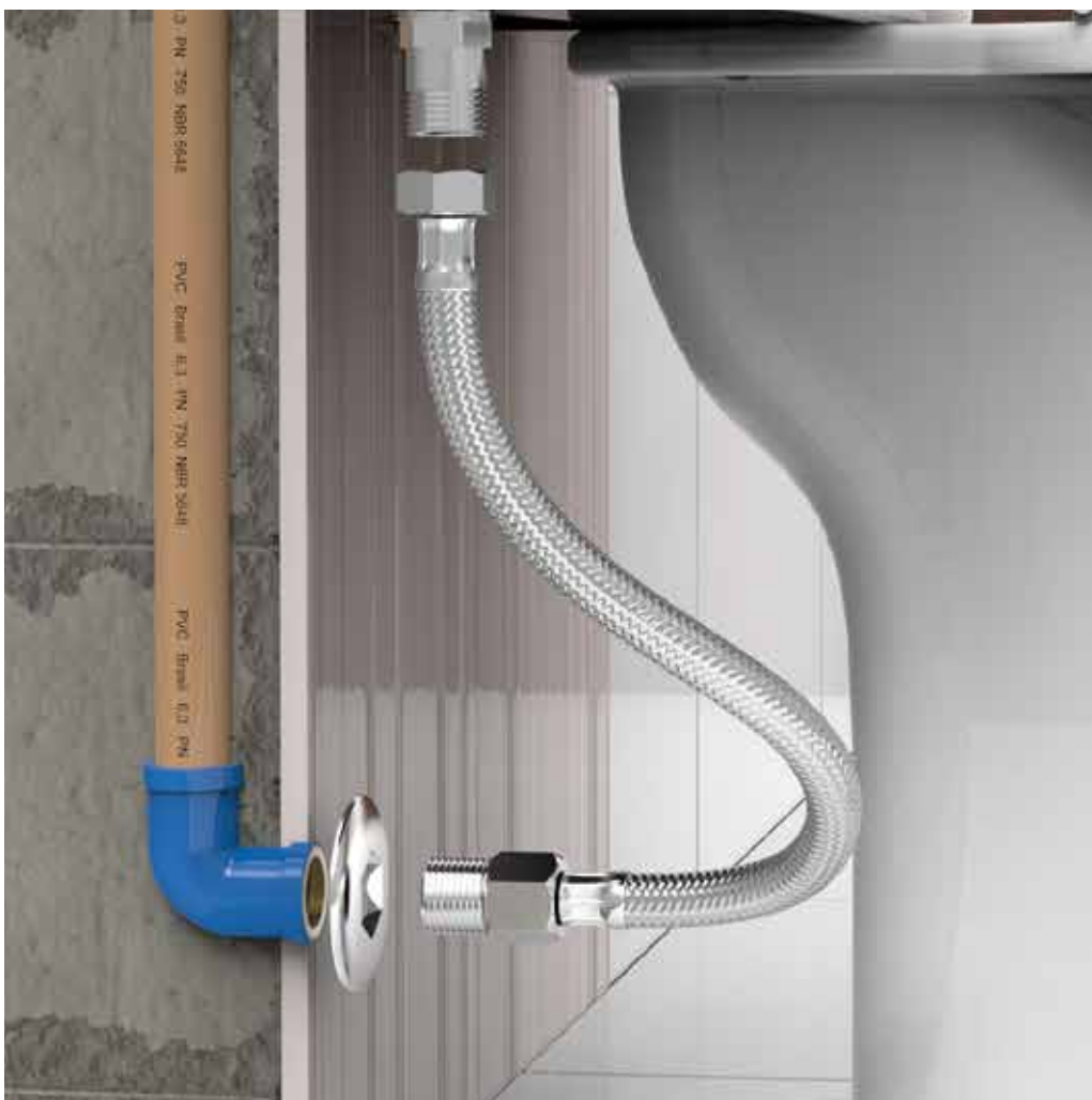
INSTALAÇÃO DO PRODUTO.