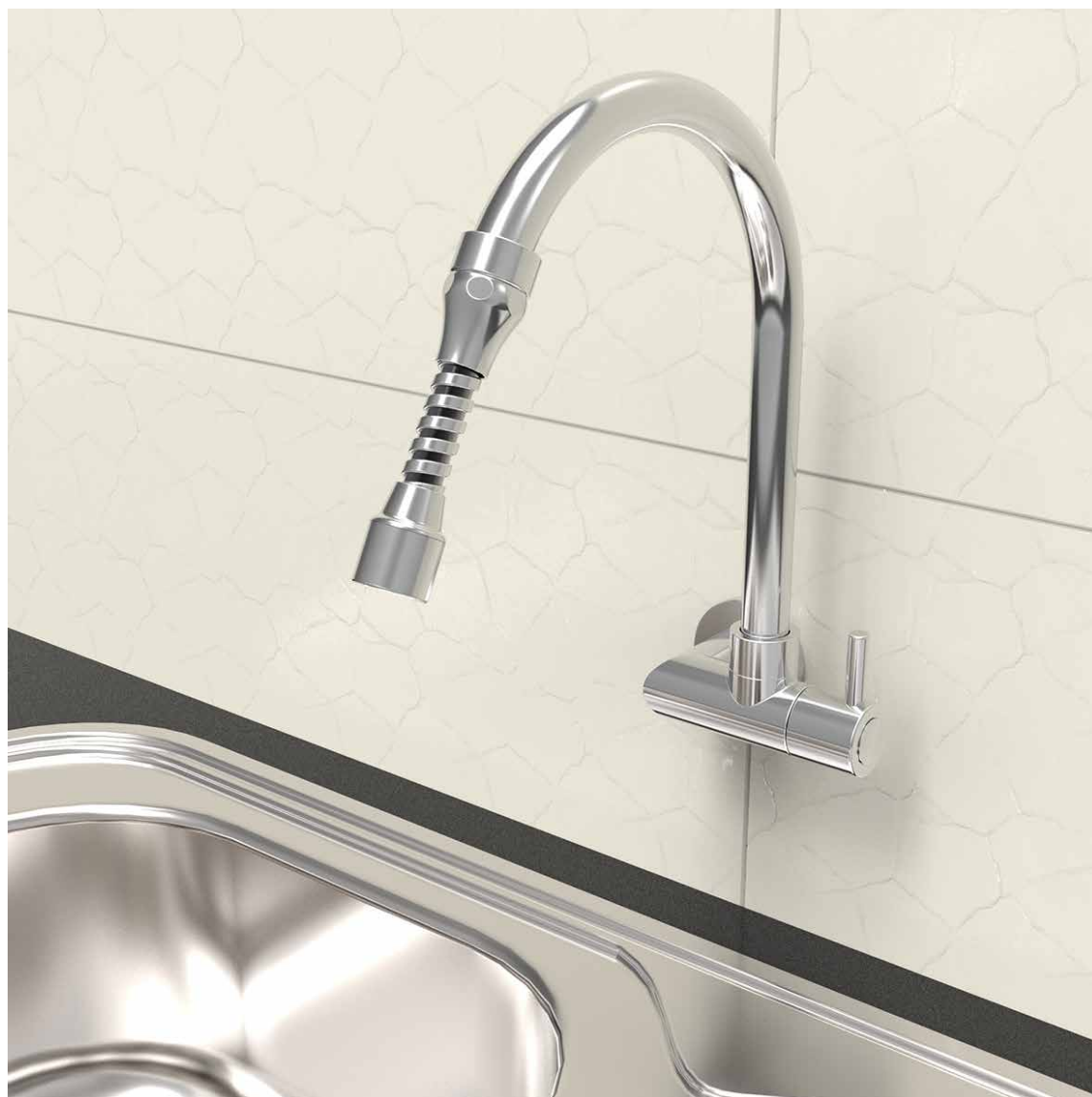
VISTA DE APLICAÇÃO.