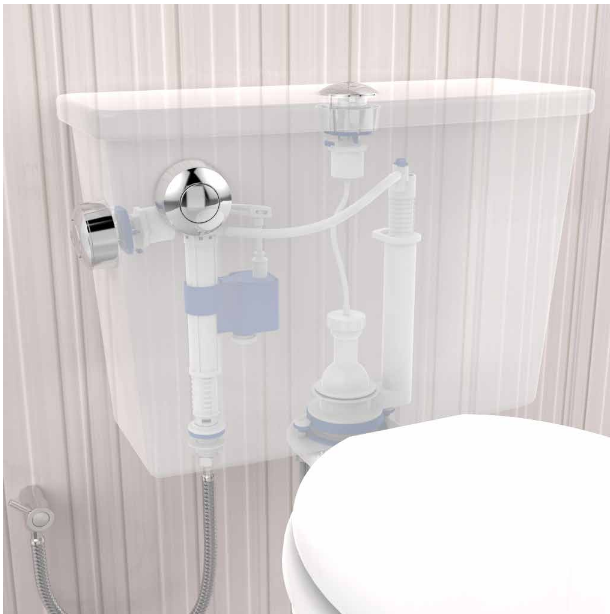
VISTA DE APLICAÇÃO.