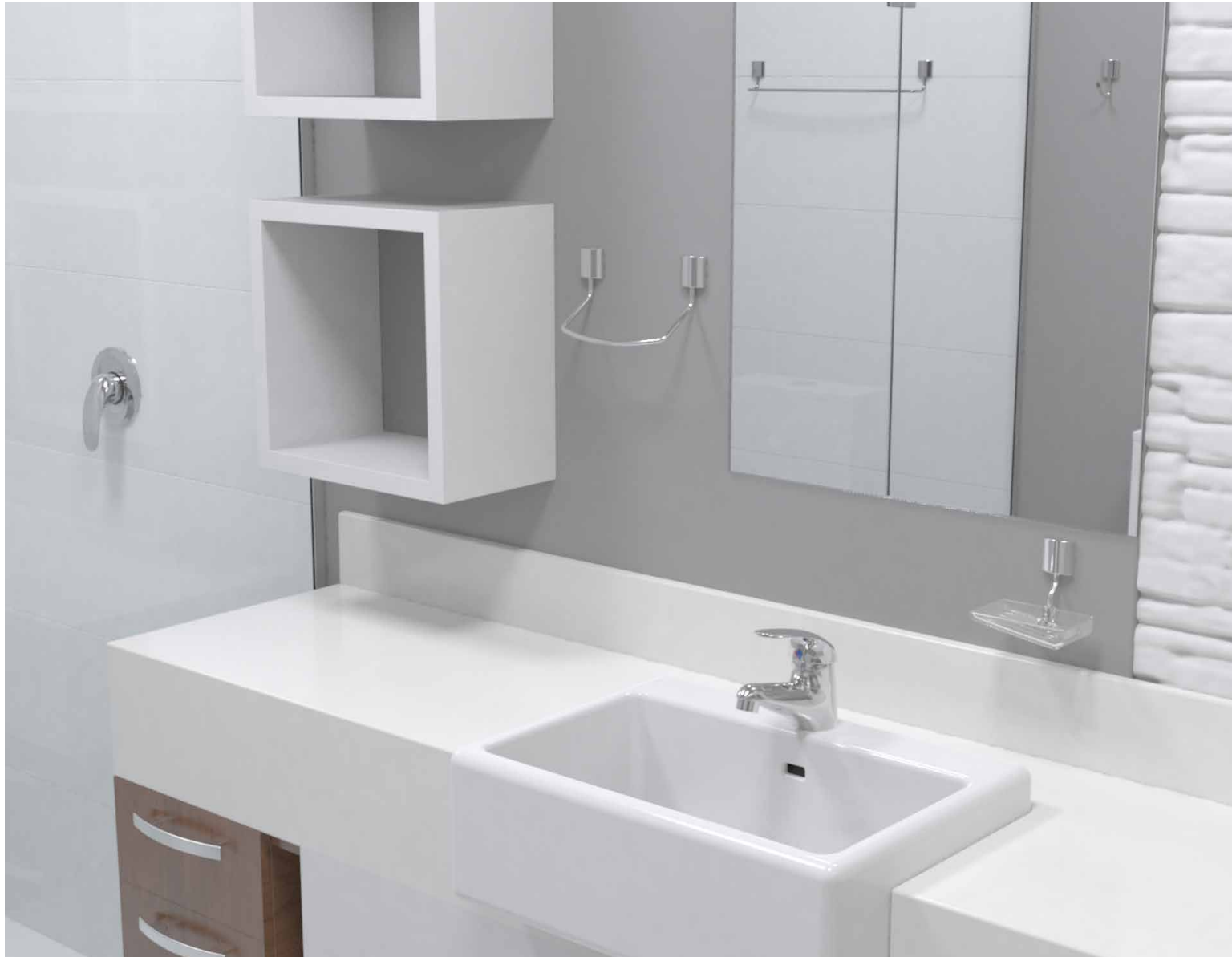
VISTA DE APLICAÇÃO.