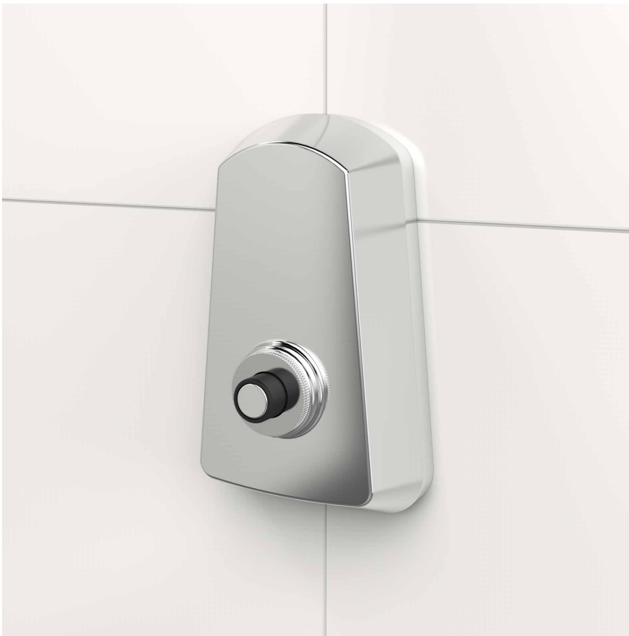
VISTA DE APLICAÇÃO.