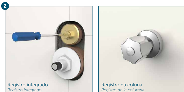
Registro integrado Registro integrado

Si la válvula posee acabado para válvula con llave (340304), retire el preme (1) para retirar la canopla (5).