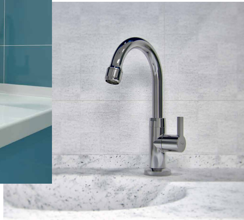
VISTA DO PRODUTO APLICADO.