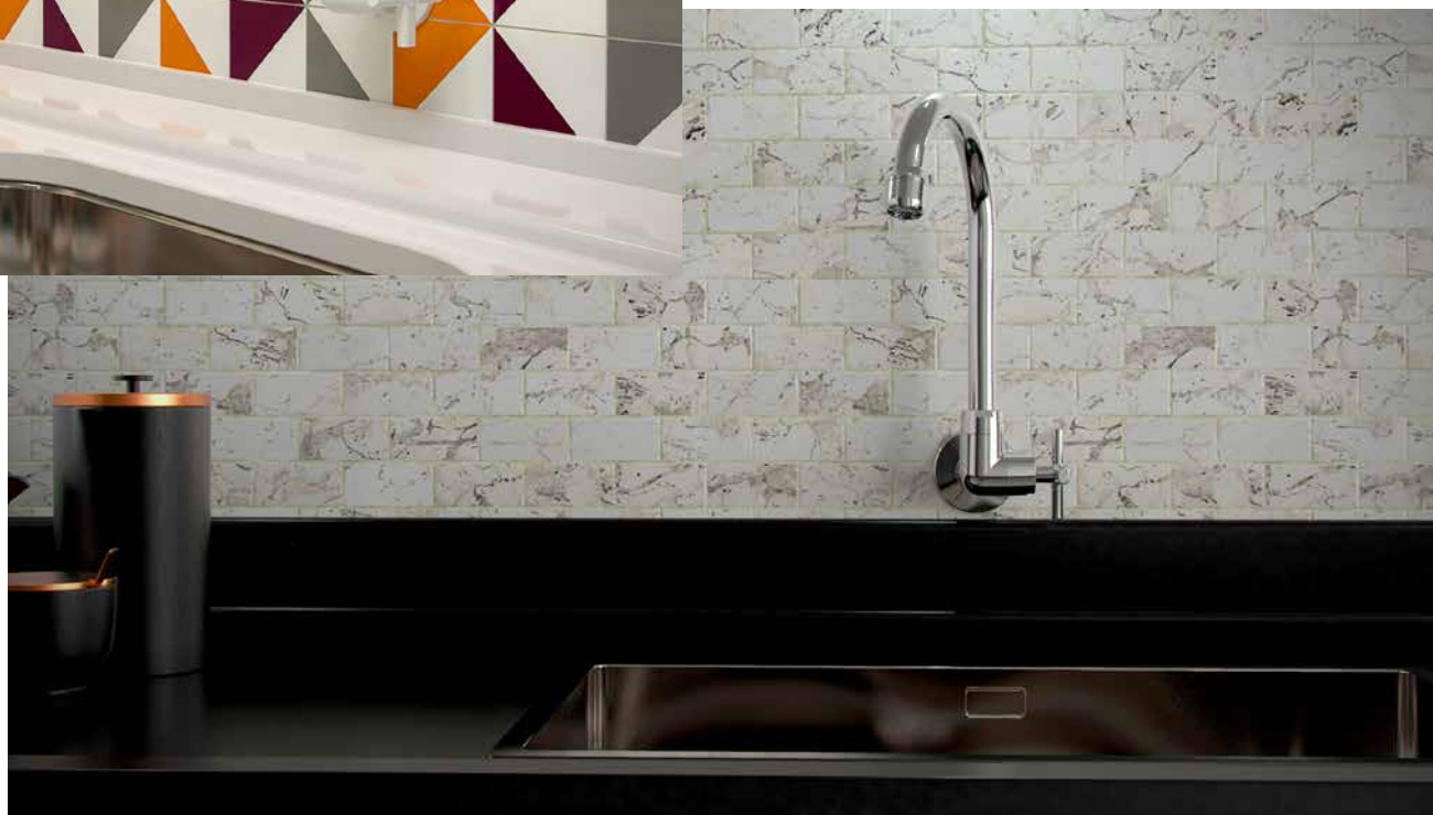
VISTA DO PRODUTO APLICADO.