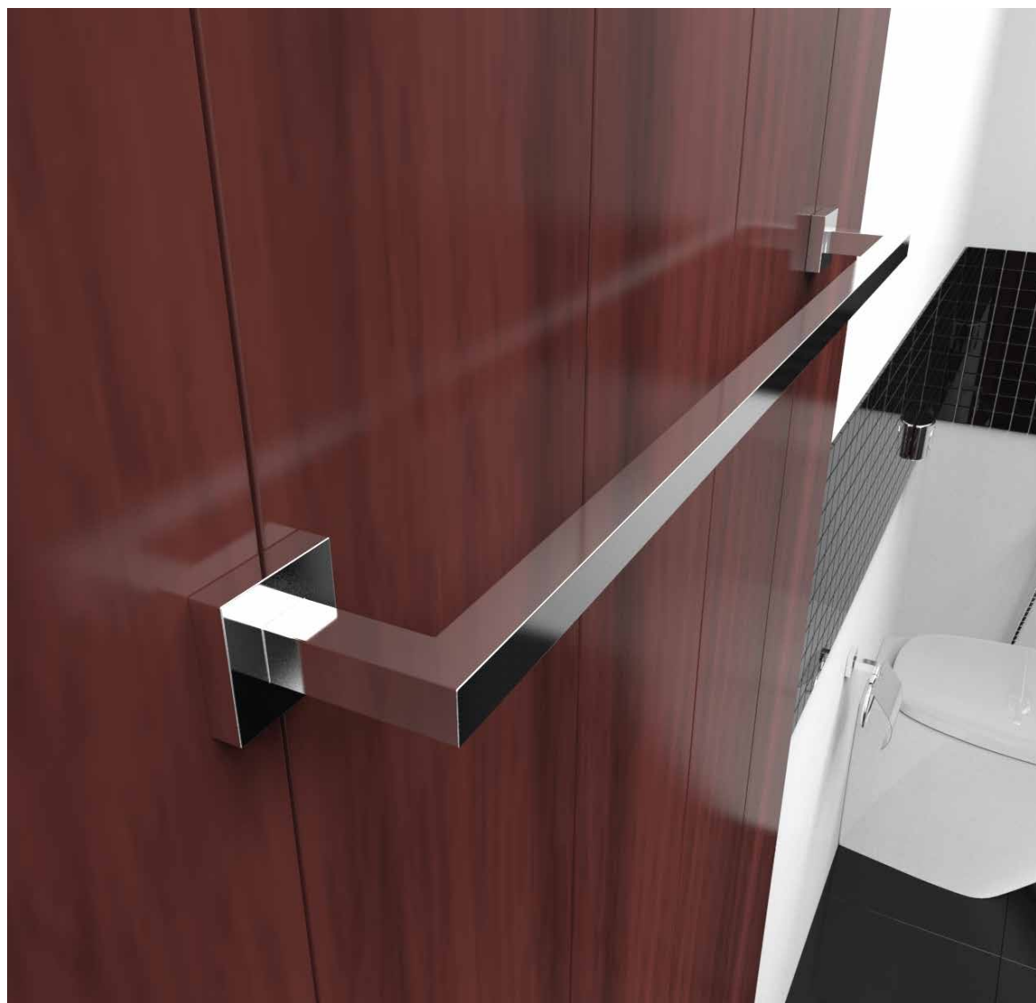
VISTA DE APLICAÇÃO.