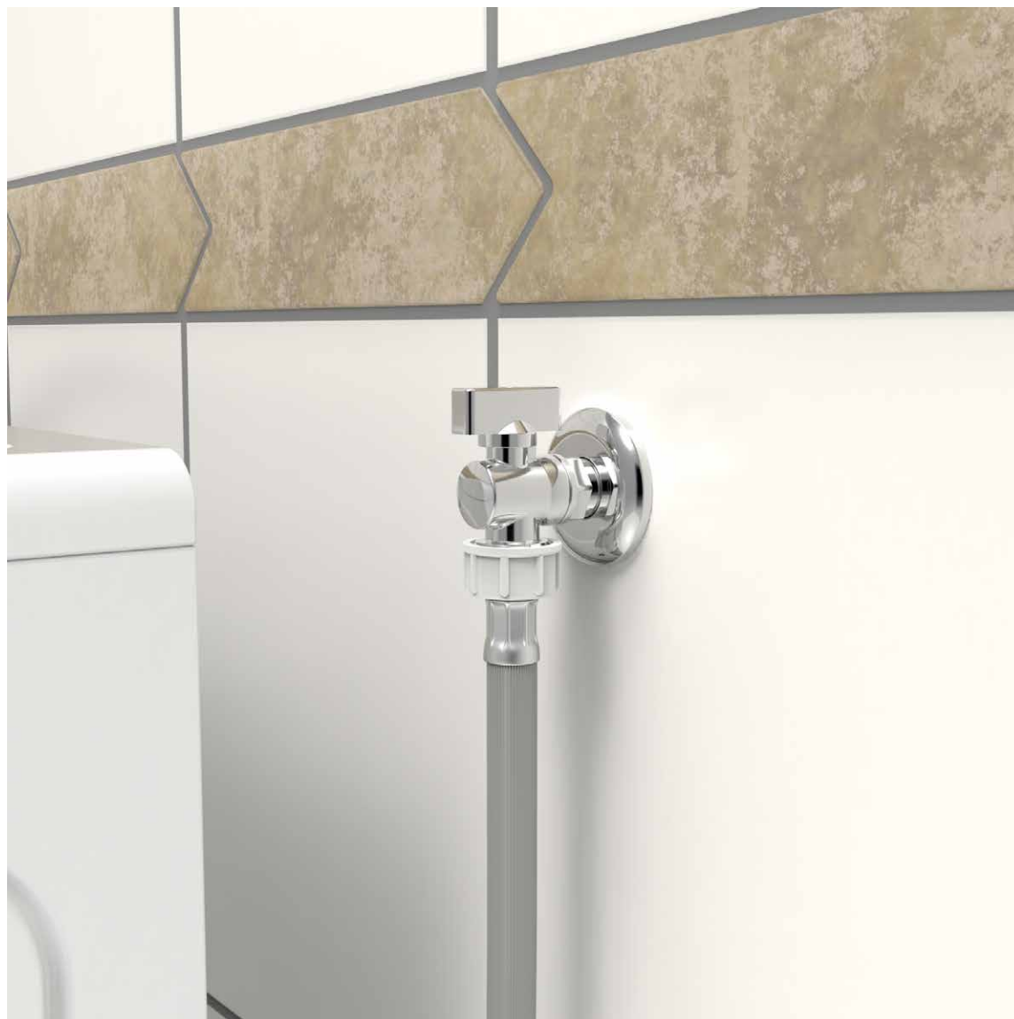
VISTA DO PRODUTO APLICADO.