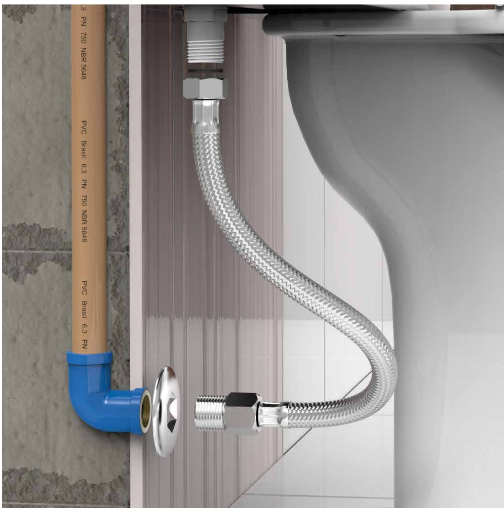
INSTALAÇÃO DO PRODUTO.