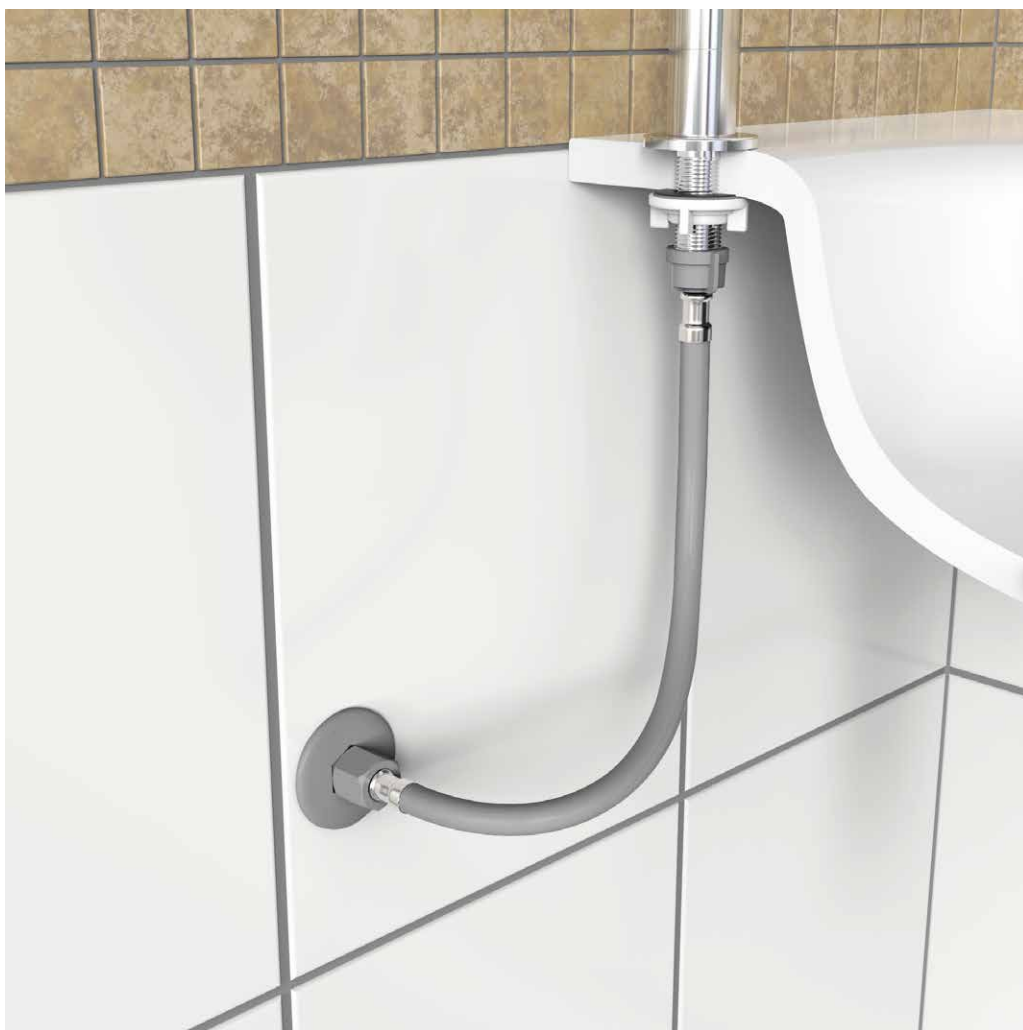
INSTALAÇÃO DO PRODUTO.