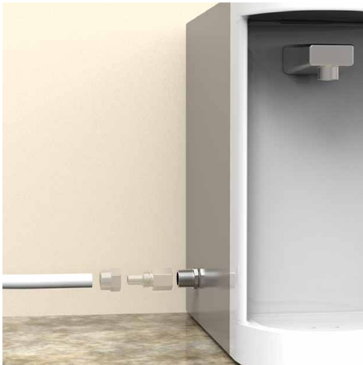
VISTA DE APLICAÇÃO.