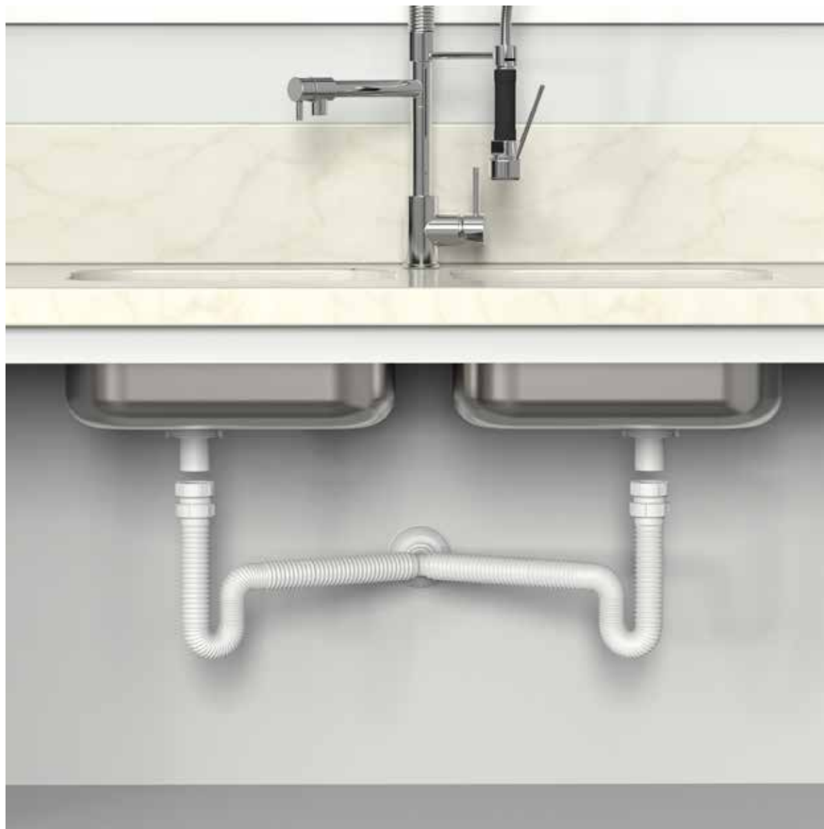
VISTA DE APLICAÇÃO.