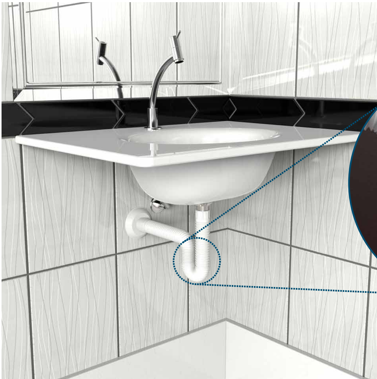
VISTA DE APLICAÇÃO.